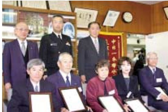
町内の自衛隊募集相談員のみなさん

当日は、町内で自衛官募集に携わる方々や関係職員が出席した中、4人がそれぞれ入隊にあたっての決意表明を行いました。