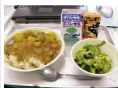
毎日の給食。お子さんが何を食べているかがよく分かりますね。

大泊小学校の通信環境は決してよいとはいえませんが、学校全体で創意工夫をしながら、情報発信に取り組んでいます。また、毎日の給食のメニューなど素朴な情報であっても、情報の更新頻度を高くして、新鮮さを保っていることなどが評価され、今回受賞の運びとなりました。コンテンツのないようはほのぼのとした雰囲気伝わってくるもので、南大隅町のファン作りにも役立っており、地域住民のリテラシー向上にも貢献しています。