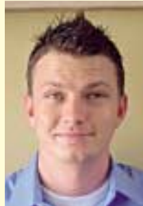
佐多地区ALT シェーン