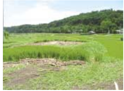
台風一過青空のもと、むなしく残る 倒伏した稲