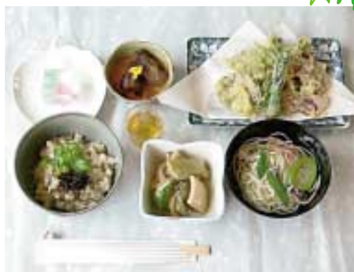
写真は、うからご膳「涼」です。

8月は夏休み特別企画としまして下記のとおり子供たちとの交流菓子作りを開催いたします。