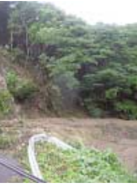
土砂により 通行不能となった 馬籠川田代線