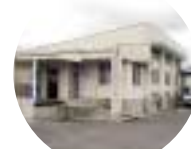
根占学校給食センター