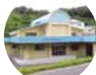
佐多学校給食センター