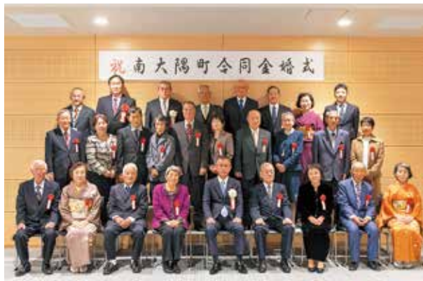
合同金婚式に参加された皆さん

新型コロナウイルス感染症防止対策のため、規模を縮小しての開催となりましたが、皆さんで結婚50年の節目を祝いました。