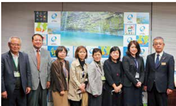
人権擁護委員の皆さん

一人一人が様々な人権問題を、「誰か」の問題ではなく自分の問題として捉え、互いの人権を尊重し合うことの大切さについて、認識を深めることが不可欠です。本町でも、無料の人権相談を実施していますので、ご活用ください。