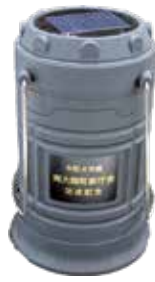
新庁舎完成記念品 ソーラー充電ランタン