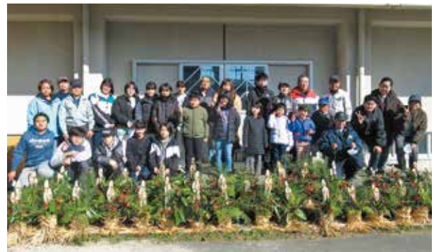
完成した門松と参加した親子

子どもたちは、社会福祉協議会「おおくす会」の皆さんの指導のもと、門松の由来や作り方を教えていただきながら、「来年もよい年でありますように・・・」との願いを込め、それぞれ立派な門松を完成させました。