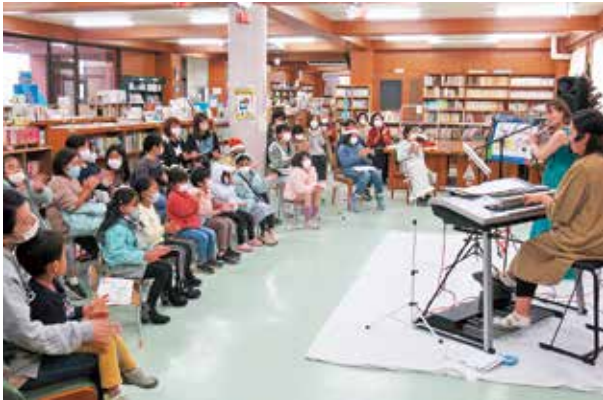
クリスマスコンサートを楽しむ参加者

最後にサンタさんがトナカイをお供に登場すると、子どもたちから歓声が上がリ、クリスマスの雰囲気も大いに盛り上がりました。