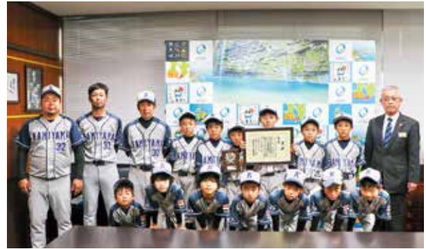
神山ソフトボールスポーツ少年団の皆さん