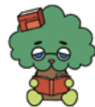
図書館キャラクター じゃっくん