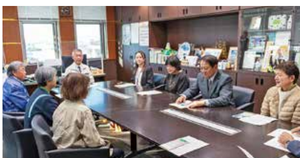
人権キャンペーンで来庁された 南大隅町・錦江町の人権擁護委員の皆さん

一人一人が様々な人権問題を、誰かの問題ではなく自分の問題として捉え、互いの人権を尊重し合うことの大切さについて、認識を深めることが不可欠です。本町でも、無料の人権相談を実施していますので、ご利用ください。