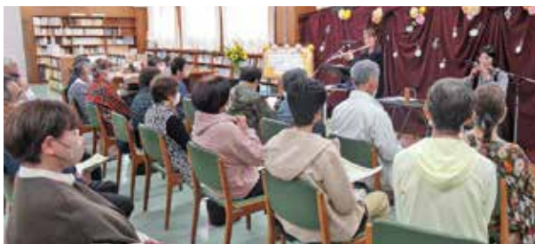
フルートとコカリナの調べに聴き入る参加者

『ばけばけテーマ曲』や『君をのせて』など日本の歌、クラシック等の名曲14曲が披露されました。フルートの透き通る音色とコカリナの温かな木の音色が絡み合い、会場には一体感と安らぎが生まれました。参加者の皆さんは、地域に身近な場所である図書館で、デュオの音色が響き渡る非日常を楽しみました。