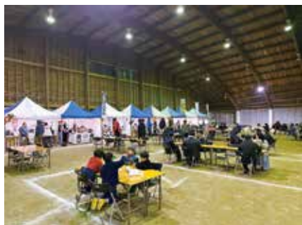
みなバル&マルシェ

町民の皆さんをはじめ、様々な人達が自由に集い、語らうことを目的とした「みなバル&マルシェ」の第4回目を令和8年1月24日(土)に、根占ふれあいドームにて開催します。