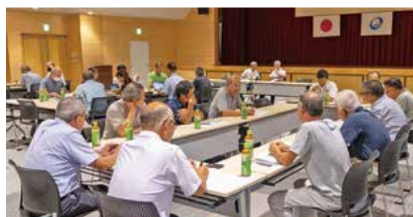
活発な意見が交わされた自治会長連絡協議会主催の町執行部と語る会

自治会長と町執行部がグループに分かれ、テーマに沿って活発な意見交換が行われました。