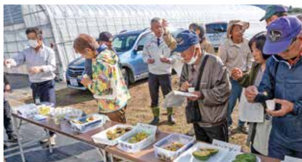
アボカドを試食し意見を交わす生産者のみなさん

アボカドは1,000種類以上の品種があるとされており、今回は町内産5品種とスーパーで売られている外国産のものを比較しました。当日は町内の生産者や鹿児島市内でアボカド料理専門店を営業されている料理人の方、関係機関などが参加し、町内産アボカドの食味や料理への活用について、さまざまな意見を交わしました。町内では、なんたん市場で購入することができます。