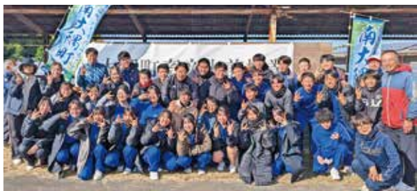
畜産出前授業を受けた町内中学校3年生

授業では、畜産に関するQ & Aや実際に子牛の登記検査を体験するなど、貴重な機会となりました。また、地元産お肉を堪能しながらの質問タイムでは、生徒から生産者への鋭い質問も飛び出しました。最後に生徒代表が「命をいただくということの意味や農家さんの努力を深く理解できました。今後の食事の中でも感謝の気持ちを忘れずにいたいです」と話され、食の大切さを改めて考える良い授業となりました。