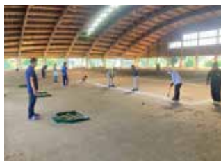
ニュースポーツ (スカットボール)