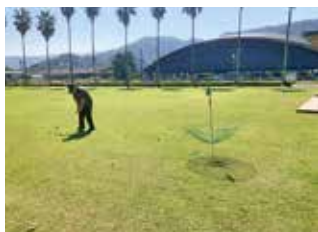
ニュースポーツ (ターゲット・バードゴルフ)