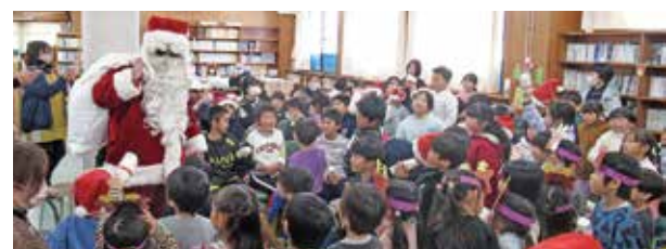
サンタさんの登場により会場の盛り上がりは最高潮に

最後にサンタさんが登場すると、子どもたちから歓声が上がり、会場は一体感に包まれました。