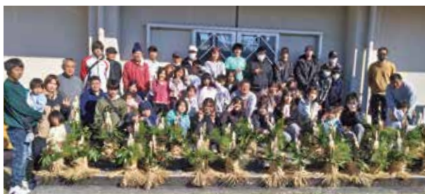
完成した門松と参加した親子

門松は新年を迎える大切な飾りであり、この門松作りは地域の文化や伝統を学ぶ良い機会となっています。