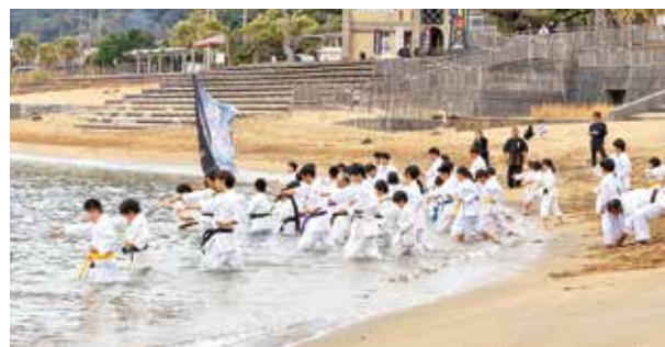
開間岳に向かい稽古をする楊心門門下生たち

門下生たちは開間岳に向かい、気合いのかけ声とともに正拳突きを繰り返していました。大きな気合いの声は、砂浜に響き渡りました。