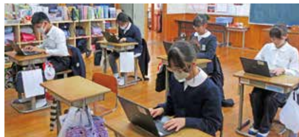
南大隅町ジュニア検定を受検する児童（佐多小学校）