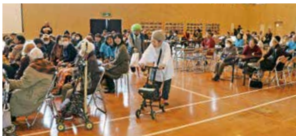
旧宮田小学校で開催された宮田のつどい

さらに、会場では同公民館が募集していた旧宮田小学校の愛称案の中から来場者が選ぶ投票も行われ、『あこうの里 宮田』が選ばれました。