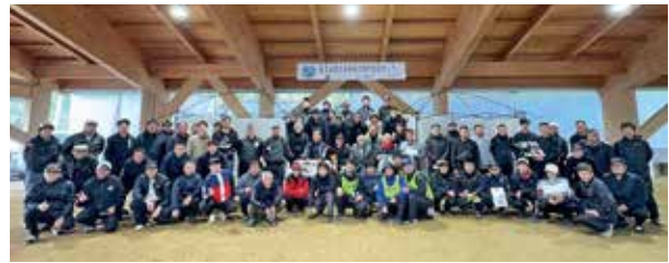
黒潮カップ in 佐多岬に参加された皆さん

今大会は参加料をふるさと納税で納めてもらう制度を設け、閉会式では特産品の抽選会などを行い、町と参加者の距離がより近くなる取組みで実施されています。