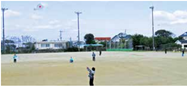
オリジナルの凧で凧あげを楽しむ参加者

青空のもと、子どもたちは元気いっぱい走り回り、凧があがるたびに「みてみて！あがったよ！」と歓声をあげながら、寒さを忘れて凧あげを楽しんでいました。イベントの最後は、食生活改善推進員の皆さんにご協力いただいた心温まる手作りぜんざいです。格別のご褒美となりました。